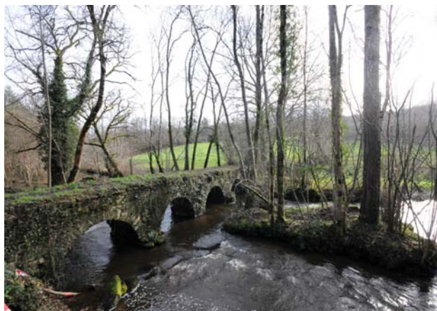
Le pont du Guédou

Les habitants de Berneuil sont appelés les Berneuillais et les Berneuillaises.