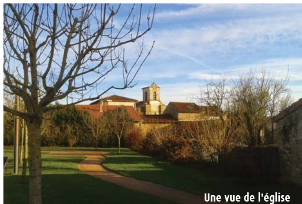
Une vue de l'église

7 Arrivé à un chemin, tourner à droite et remonter vers la RN147. A la route, la suivre à droite puis traverser pour rejoindre la place de la mairie et le parking.