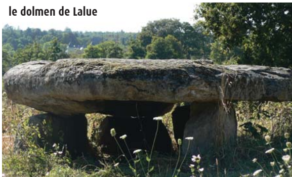
le dolmen de Lalue

L'installation humaine au néolithique est attestée par différents ensembles mégalithiques, comme le dolmen de la Borderie à Berneuil (-2 650 av. J.-C.) et le mobilier funéraire trouvé avec, attestant du commerce (flèches, coquillages, parures...).